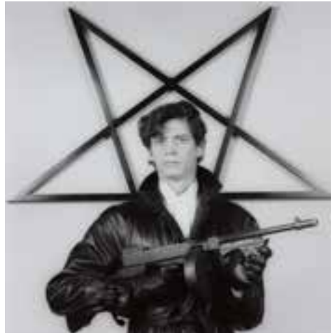
Robert Mapplethorpe Self Portrait 1983

Yn Self Portrait 1983 mae Mapplethorpe yn dangos ei hun mewn gwisg ryfel (siaced ledr), yn gosod ei hun fel ffigwr chwyldroadol, reiffl yn ei law, o flaen ei gerflun Black Star 1983, sydd ar ffwrdd wedi'i phaentio'n ddu mewn siâp pentagram. Mae'r pentagram arbennig hwn o chwith (un pwynt yn wynebu i lawr) a gellir ei ddehongli felly fel symbol o'r Diafol. Yn ddiweddarach, hoffai Mapplethorpe, a gafodd ei