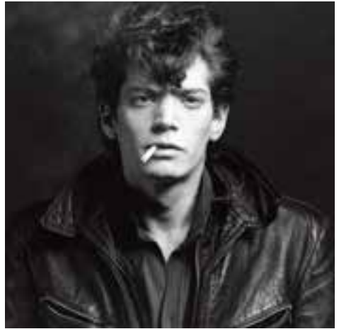
Robert Mapplethorpe Self Portrait 1980

Cafodd Mapplethorpe foddhad mawr wrth gymryd ffotograffau Polaroid yn eu rhinwedd eu hunain ac ym 1973 cynhaliwyd ei arddangosfa solo gyntaf yn arddangos lluniau polaroid yn y Light Gallery yn ninas Efrog Newydd. Dwy flynedd yn ddiweddarach cafodd gamera fformat cymhedrol Hasselblad a dechreuodd gymryd ffotograffau o'i ffrindiau a'i gydnabod – artistiaid, cerddorion, ffigyrau amlwg mewn cymdeithas, sêr ffilmiau pornograffaid, ac aelodau is-ddaear Efrog Newydd.