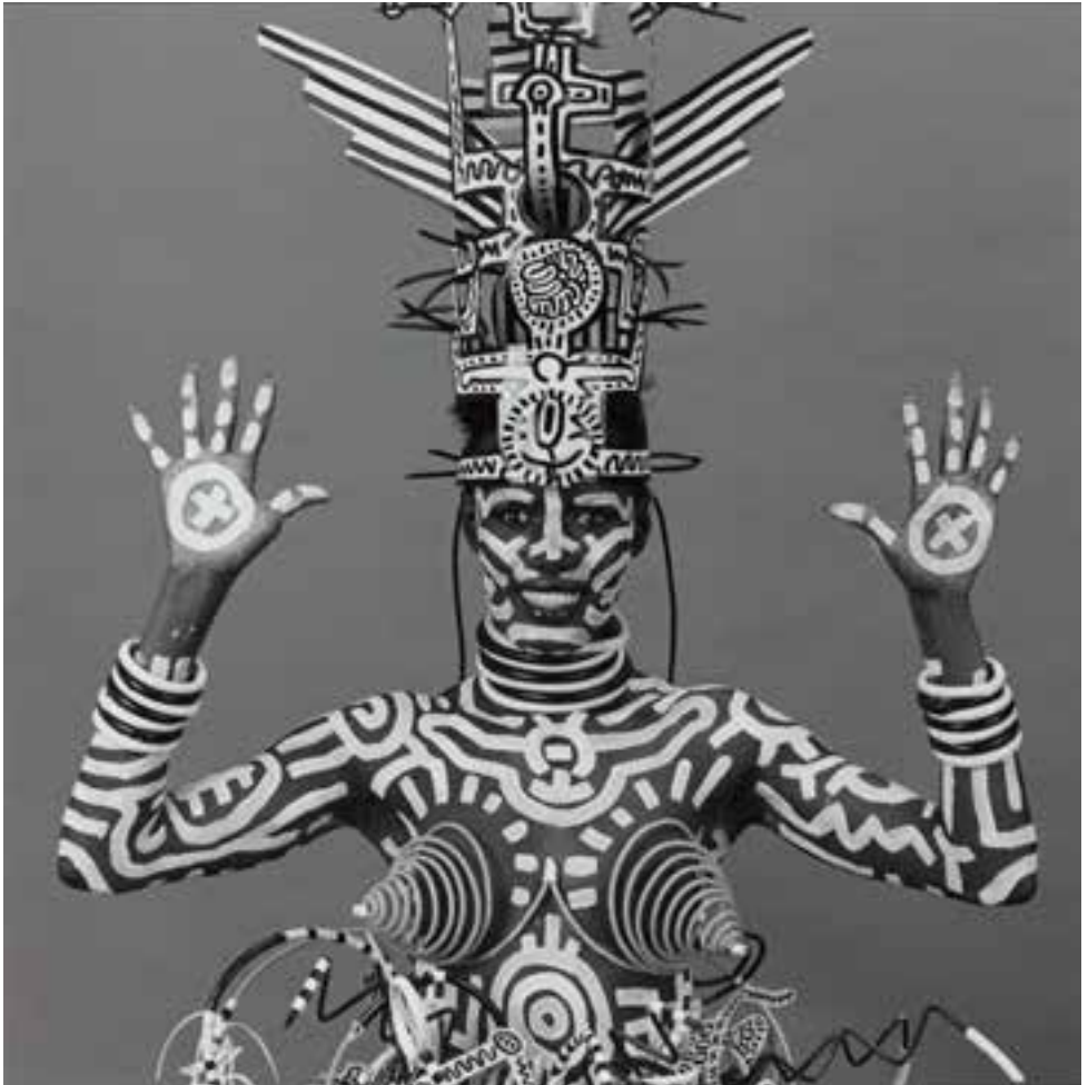
Robert Mapplethorpe Grace Jones 1984

wrthrychau yn cynnwys unigolion o gyd-destunau diwylliannol a chymdeithasol eang: yn amrywio o'r teulu brenhinol ac aristocratiaeth i rentlanciau, ond 'roedd cyfran helaeth o'i bortreadau o'r 1980au yn nodweddu ffigyrau blaenllaw, llawer ohonynt ym maes y celfyddydau.