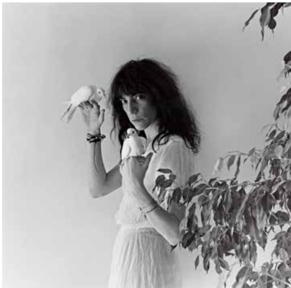
Robert Mapplethorpe Patti Smith 1979